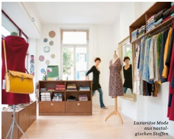
Luxuriöse Mode aus nostalgischen Stoffen